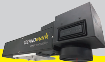
インライン特化レーザー