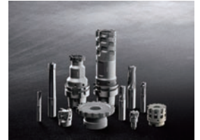
PCD ミーリング工具 アルミ加工用