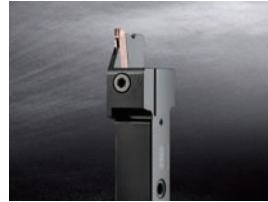
内部給油式ツールホルダー 229 すくい面+逃げ面からの冷却