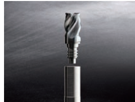
ヘッド交換式カッター DG 段取り時間の短縮を実現