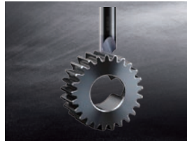
歯車端面バリ取り工具 約 2 秒で完了 高速バリ取り加工