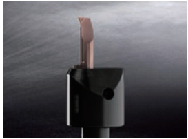
焼結チップブレーカー U形 下穴径φ6.0～ボーリング用