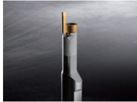
端面深溝用インサート 114 最大溝深さ 10 mm に対応