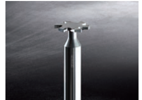
超硬ソリッドカッター 鋭い切れ味と高性能コーティング