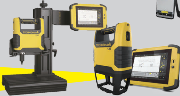
ワイヤレス/タッチパネル