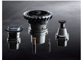
超硬ギヤスカイピング工具 m 0.2 ～ m 8.0 に対応